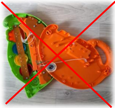
Ei rikkiäisiä leluja