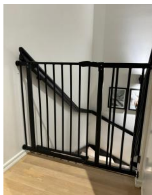
Asenna portaisiin turvaportti.