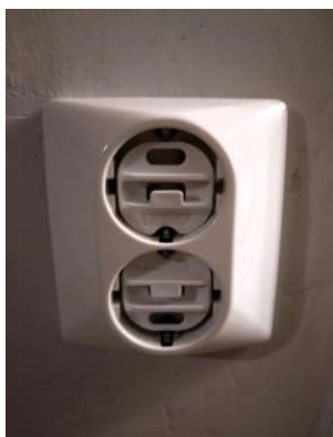
Suojaa pistorasiat suojatulpilla.