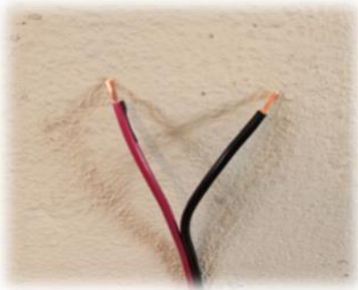
Poista rikkiiniset sähkölaitteet käytöstä