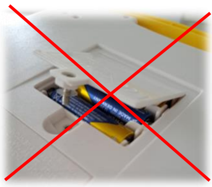
Suojaa paristot lapsilta